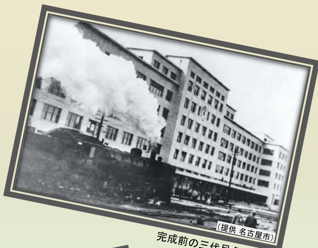
完成前の三代目名古屋駅 昭和12(1937)年