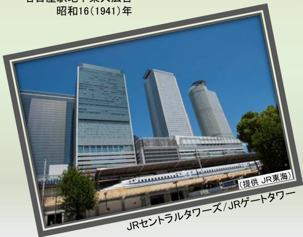
JRセントラルタワーズ/JRゲートタワー