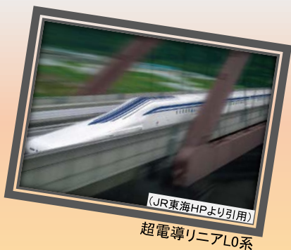
超電導リニアL0系