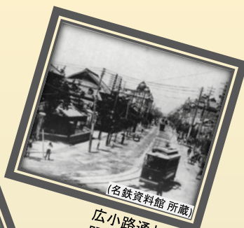
(名鉄資料館 所蔵) 広小路通と市電 明治40(1907)年