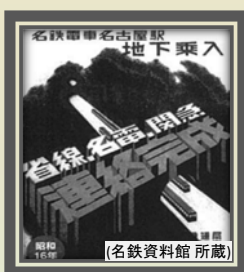
名古屋鉄道・近畿鉄道 名古屋駅地下乗入広告 昭和16(1941)年