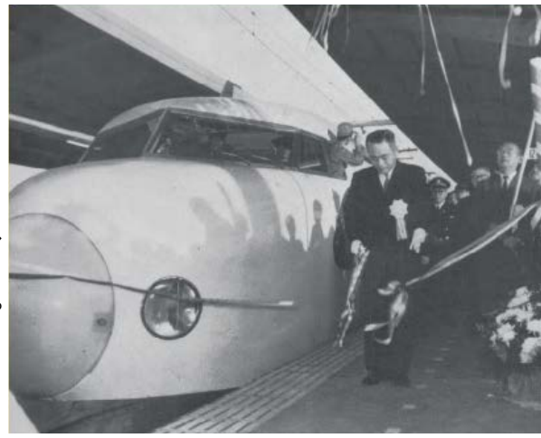
昭和39(1964)年 東海道新幹線開業

土 木学会中部支部は土木技術の素晴らしさ、土木事業の重要性等を理解して頂く活動を始めてから今年で80年を迎えます。そこで、今回、80周年記念に『名古屋の交通インフラの発展』をテーマに写真展を開催する運びとなりました。不毛の地であった熱田台地に名古屋城と堀川運河を建設したのを皮切りに、東洋一の名古屋駅をつくり、空襲をバネにしてさらに道路網を整えた名古屋は、リニア開業を起爆剤に今後目まぐるしく変化していくことでしょう。本写真展では、近代の街の姿を映した貴重な記録写真や映像を数多く集めて紹介します。ぜひ、当時を偲んで頂くと共に、進化し続ける名古屋の交通と将来像を皆様が創造する機会になれば幸いです。