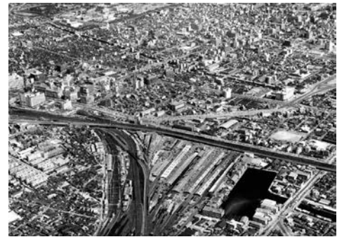
昭和40(1965)年 名古屋駅前