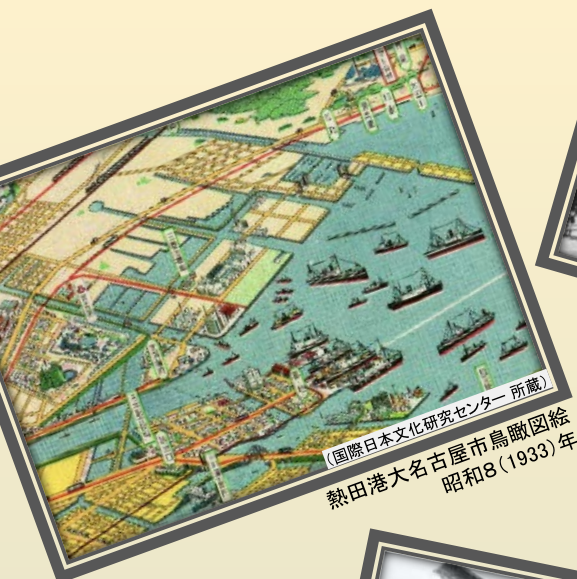
熱田港大名古屋市鳥瞰図 昭和8(1933)年