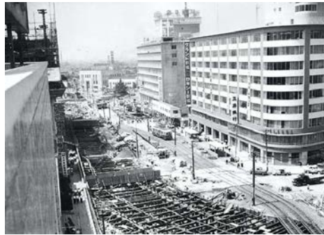
昭和31(1956)年 名古屋駅前地下鉄工事