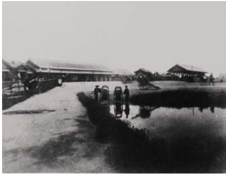
明治20(1887)年 初代名古屋駅