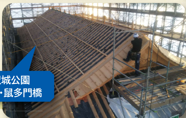
3 金沢城公園 鼠多門・鼠多門橋