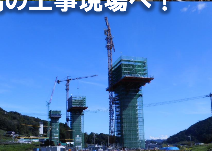
(国) 473号バイパス工事