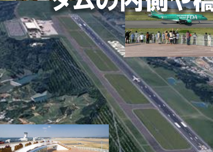
富士山静岡空港