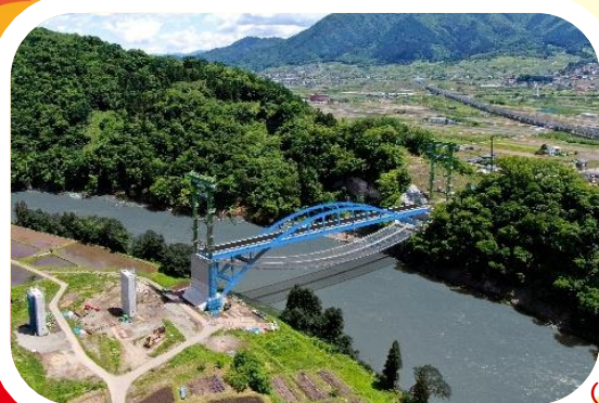
(仮称) 笠倉壁田橋 (中野市)